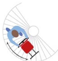
Scala chiocciola / Spiral staircase